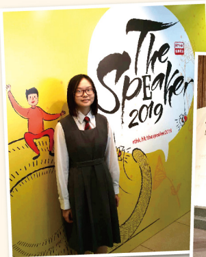
▲ 香港電台The Speaker 英語演講比賽優異獎