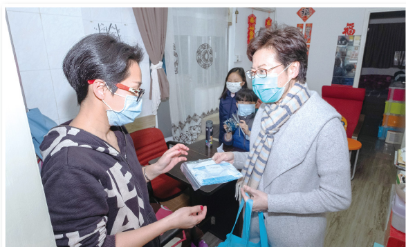
▲ 行政長官向基層住戶派發口罩