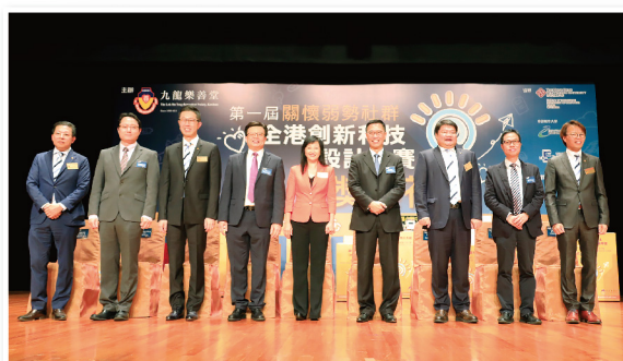
▲樂善堂舉辦「第一屆關懷弱勢社群—全港創新科技設計大賽」頒獎典禮，邀得教育局局長楊潤雄太平紳士（右四）擔任主禮嘉賓

榮獲冠、亞軍的隊伍亦同時獲得參加德國STEM考察的機會，考察團於12月17日至24日遠赴德國，走訪了德國三大科技重要城市，包括慕尼黑、法蘭克福和斯圖加特。同學們除參觀多個與科技發展相關的博物館和馳名車廠外，更參加了STEM工作坊，整個旅程讓他們大開眼界，收獲豐富。