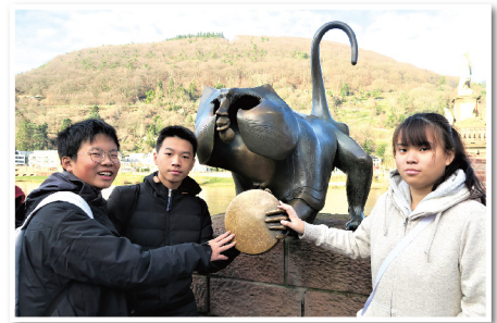
▲ 同學在旅程中吸收了不少科技上的知識，更認識了不少德國文化，絕對是一個難忘的體驗