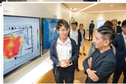
同學介紹透過人工 智能技術實時掌握場地人流 分佈情況