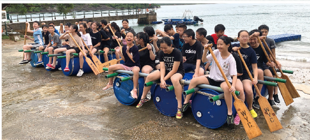
▲ 為轄屬中學舉辦歷奇訓練營，鍛鍊學生的解難能力及建立朋輩間的支援網絡