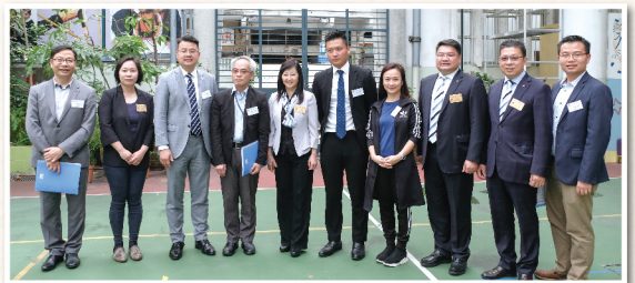
▲ 樂善堂獲得運輸及房屋局及九龍城區不同持分者的支持

此外，本堂獲運輸及房屋局支持，申請短期租用位於宋皇臺道及土瓜灣道交界閒置土地興建「組裝合成屋」作過渡性社會房屋。項目於去年 7 月已獲九龍城區議會全體區議員支持，預計本年下半年展開工程，目標於 2021 年第二季前正式入伙，預計提供約 110 個單位，受惠人數約 400 人。在此，本堂十分感謝運輸及房屋局鼎力協助以及九龍城區不同的持分者支持和意見。