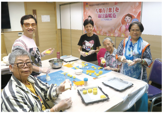
▲ 由義工製作低糖月餅送予區內獨居長者