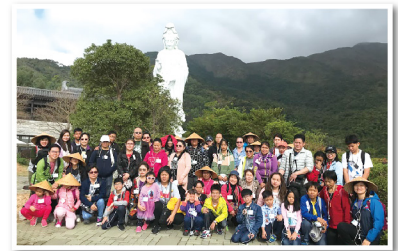
▲ 泰裔家庭參觀寺廟進行文化交流

除了功課輔導班、足球班、籃球班等活動外，我們亦舉行了與少數族裔息息相關的課程及活動，例如：板球班、泰國舞蹈班、民族手繪班(Henna)、巴基斯坦美食製作班，更舉行中國國術詠春班，讓華人與少數族群學童親身體驗泰國、巴基斯坦及中國文化，藉此向大眾展現九龍城多元文化的一面，並向社區人士推廣共融訊息。