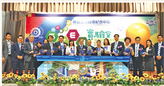
▲ 梁氏家族STEM實驗室暨環保科技學苑啟動禮