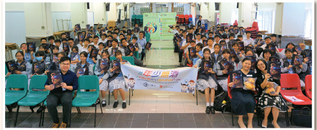
▲ 中學生踴躍參與互動講座，並與衛生署吉祥物區獅Lion大合照