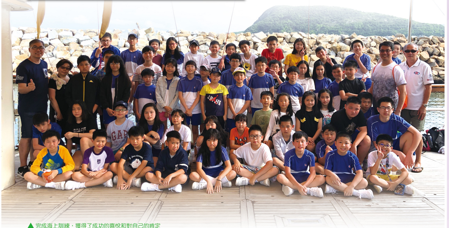
▲ 完成海上訓練，獲得了成功的喜悅和對自己的肯定