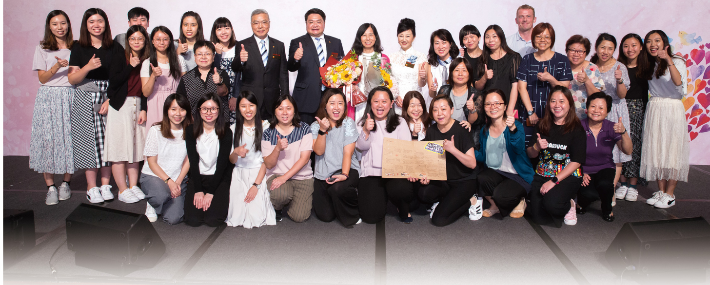
▲ 總理們頒發退休獎金予轄屬單位之同工，並與一眾同工合照留念