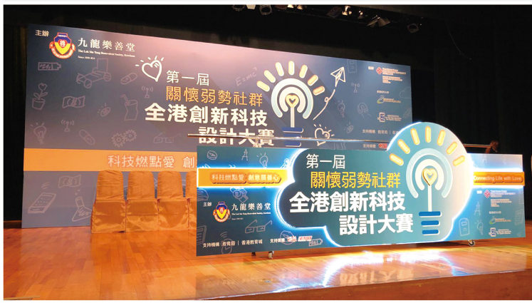
▲ 宣傳用品設計及道具製作

為擴展業務和提供多元化服務，樂善製作成功加入多間政府部門的供應商名單，當中包括：香港警務處、食物環境衛生署、政府物流服務署、康樂及文化事務署、漁農自然護理署、民政事務總署和香港海關等等。