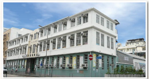
▲ 全港首個「改建校舍」作過渡性社會房屋項目

樂善堂自 2017 年自資推展「過渡性社會房屋」項目，並納入恆常服務項目。本堂社會房屋計劃「樂屋」已開展至第四期計劃，共提供 88 個社會房屋單位，受惠家庭超過 100 個，讓原本住在天台屋、劏房和鐵皮屋的家庭重新獲得溫暖的安樂窩。