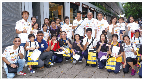
▲ 愛心大使及總理打氣團到各區為賣旗義工打氣