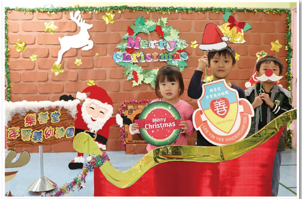
校園開放日暨聖誕親子嘉年華 ▲

本年度,學校分別獲得香港基督教服務處與教育局合辦的「關愛校園獎」及香港幼稚園教育專業交流協會頒發的「愛心小天使」學校大獎外,我們更邀請美國專家到訪學校,經評審後於2019年獲認證為「國際啟發潛能學校二星銀獎」的殊榮。