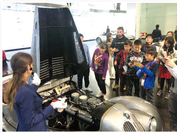
▲獲獎同學參觀多個與科技發展相關的博物館和馳名車廠，大開眼界