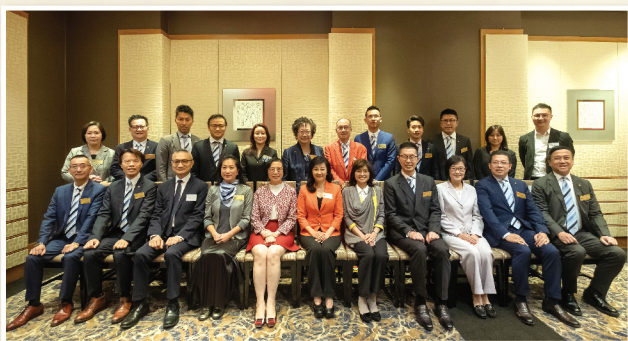
▲ 食物及衛生局局長陳肇始教授太平紳士(前排左五)、衛生署署長陳漢儀醫生太平紳士(前排右三)及其他官員與本堂總理共享午餐