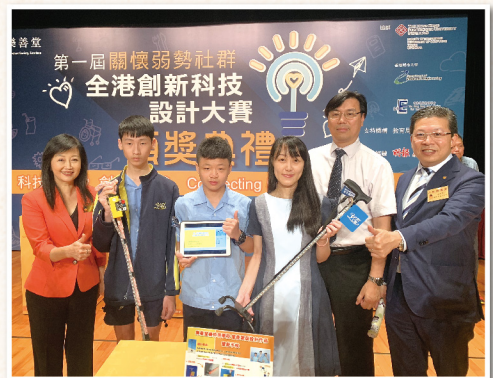
▲ 透過設計幫助弱勢社群的產品，以科技及創意貢獻社會

九龍樂善堂作為本港辦學團體之一，近年積極在轄屬學校推動「科技與環保」教育。本堂主辦「第一屆關懷弱勢社群 — 全港創新科技設計大賽」，並有幸邀得教育局局長楊潤雄太平紳士擔任主禮嘉賓及進行頒獎。是次比賽以「關懷弱勢社群」為主題，對象為全港中、小學生，除了推動創新科技教育，更希望傳遞關懷身邊有需要人士的訊息，透過設計幫助弱勢社群的產品，以科技及創意貢獻社會。比賽中獲得冠亞軍的隊伍更到德國進行境外學習考察活動，與當地科創機構進行交流，擴闊視野。