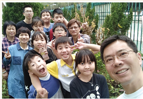
▲ 來張大合照！一、二、三，笑！

2019年12月23日，放聖誕假的一天，校長、學生、工友十多人聚在一起，目標一致：重鋪校園植物徑。整個工程，不用支出費用外聘材料、人手或服務，大家用的只是往年學校大修遺留下來的地磚，再加上一份建設校園的熱情和對學校的歸屬感。回來幫手的，是四至六年級的學生及一名中一校友，他們年紀小小，但動力極高，力量也大，由起舊磚、搬磚、平整小徑泥土及重鋪新磚，都幹得起勁。累了，午後停工，師生共膳，樂事也。膳後復工，又再全力以赴，原本預計兩天的工程，結果一天便完成了，真是齊心事成，成功滿滿的。