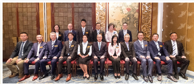
▲ 運輸及房屋局局長陳帆太平紳士(前排左六)與本堂總理共晉午餐