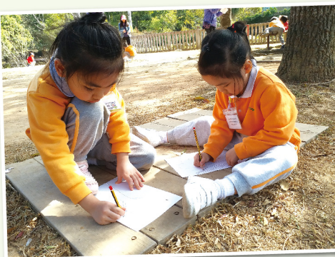
▲ 高班學生在「西貢焦坑」作觀察記錄