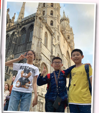
▲ 學生到訪奧地利及德國