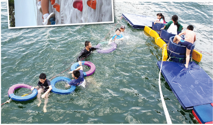
◀ 要完成海上任務，不止需要勇氣，更需要的是朋輩的支持和信任

本年度學校得到乘風航及香港青年協會的邀請，為高小的學生安排了多次歷奇活動，讓學生體驗在課堂以外的特別經歷。大部分學生在活動開始時都顯得無奈及抗拒，甚至有人哭泣及發脾氣，但聽到部分同學挑戰成功分享及導師的鼓勵下，這班驚慌的同學終於願意離開自己的「舒適圈」，克服畏水畏高的恐懼，完成了任務。事後同學們回顧這些經驗，除了覺得難忘之後，亦更認同只要抱持樂觀的心和鼓起勇氣，面對逆境仍然可以積極面對。