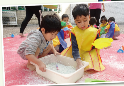
低班學生進行戲劇活動 ▲