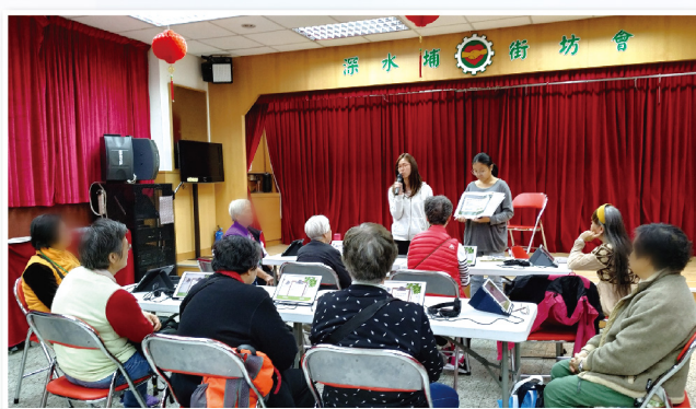
▲ 使用電子程式為年長人士進行認知能力測試

本堂獲香港賽馬會慈善信託基金贊助，開展賽馬會「與耆同行」腦退化症支援計劃，向 3,000 名 50 歲以上人士作早期腦退化檢測並作出相應跟進。這項創新的試驗計劃為期三年，目的在社區內推廣認知障礙症之早期篩選及跟進服務，協助未能受惠於公營醫療的早期認知障礙症患者及其家庭照顧者，建立以家庭為本的照顧模式，改善患者長遠福祉。其次，透過在社區內推廣，從而提升大眾對大腦健康、輕度認知障礙及腦退化症的關注與認識。