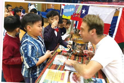
◀ 學生積極參與International Culture Week活動