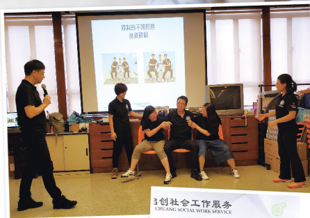
◀ 在英國NFPS人本脫身法及空制法認證課堂中，組員分組進行練習