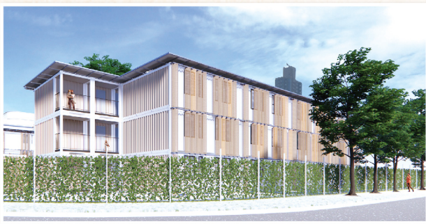
▲ 以「組裝合成屋」作過渡性社會房屋

除了「樂屋」，本堂推行首個改建校舍作過渡性社會房屋的先導計劃。本堂於去年 7 月獲得扶貧委員會通過及撥款資助改建樂善堂小學閒置校舍作過渡性社會房屋。協助解決基層家庭的短期住屋需要外，同時秉承「社區為本」的服務原則，建立共享空間及提供服務支援，為基層家庭締造理想及舒適的生活環境。校舍改建工程已於本年第一季開始，期望讓家庭能於本年第二季入伙，預計項目能提供約 50 個過渡性社會房屋單位，受惠人數約 180 人。