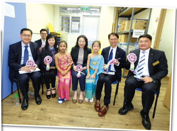
◀ 鄭司長等到訪樂善堂李賢義裔群社