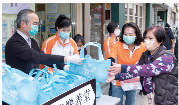
▲ 劉江華局長(左一)向少數族裔居民派發口罩

時任民政事務處處長劉江華太平紳士於 2020 年 3 月 6 日到訪樂善堂李賢義裔群社 — 少數族裔支援服務中心，向少數族裔居民派發口罩。