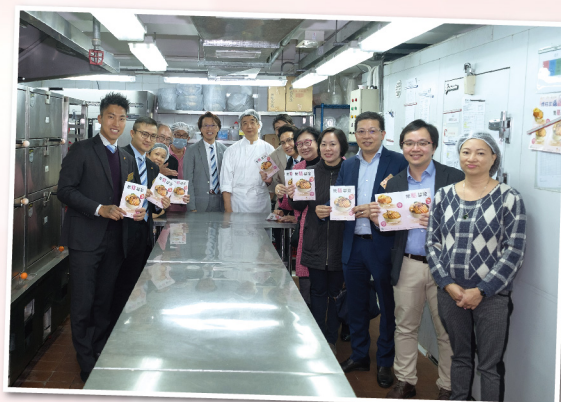
▲ 總理同寅參觀「樂善堂佳寶營養膳食中心」，了解單位日常運作