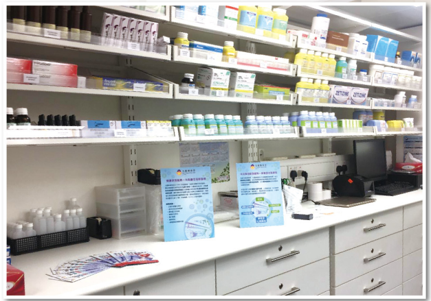
▲「社區藥房」提供價格相宜的藥物