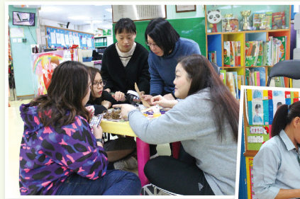
◀教師進行「戲有益」培訓活動

此外，推行「Messy play 感官遊戲日」是本校的第二項重點發展。為配合教育局的自由遊戲學習，本校除了日常課程外，更安排 Messy play 遊戲於課堂活動中，學生可以自由自主地選用不同材料去創作及玩樂，例如：探索麵粉與水的關係，水的多少如何影響麵團的形狀？當中經由搓揉的過程中，一方面能刺激感官發展，另一方面能訓練學生的精細動作，讓學生從自由遊戲中，培養發現學習 (discovery learning) 2 的技能和態度。