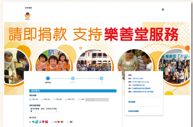
▲ 平台提供更多捐款方式，方便大眾