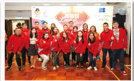
▲愛心企業義工隊穿上整齊制服，準備出發探訪