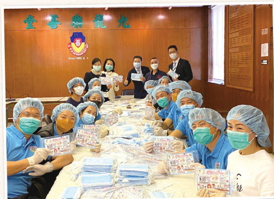
▲ 義工們幫忙包裝口罩