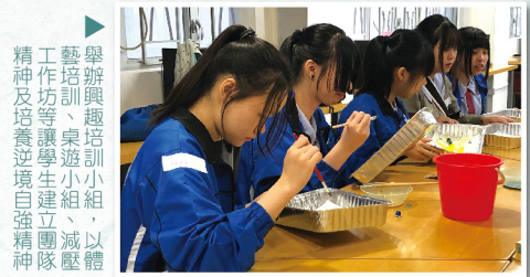
▶ 舉辦興趣培訓小組，以體藝培訓、桌遊小組、減壓工作坊等讓學生建立團隊精神及培養逆境自強精神

本堂一直致力推動青少年教育工作，關注學生成長需要。本堂於 2018 年 9 月獲保安局禁毒基金資助在轄屬 6 間中學推行第二期為期 3 年的「陽光青年計劃」，為超過 4000 名學生提供健康發展的活動。陽光青年計劃 2019-20 年度以「鍥而不捨，堅持到底」為題，目的為提升學生對自我的認識，建立積極的人生觀。計劃亦會為學生提供快速健康測試及壓力情緒支援服務，並為有需要的學生提供適切的支援。除此之外，本堂於 2019 年 9 月起與博愛醫院歷屆總理聯誼會梁省德學校合作，推展健康校園計劃（自願性校園測檢計劃），並已服務該校超過 700 名學生。