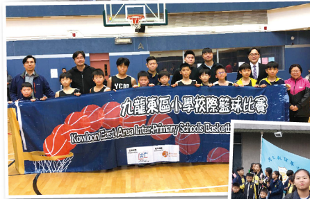
◀ 籃球隊三名主力球員入選九東聯隊