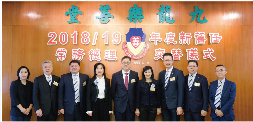
▲九龍樂善堂二零一九年度常務總理會主席團大合照

「二零一九年度新舊任總理交替儀式」於2019年4月1日（星期一）假本堂總辦事處三樓會議廳進行，並由九龍城民政事務專員郭偉勳太平紳士蒞臨主禮，見證新一屆常務總理會履新，儀式簡單而隆重。