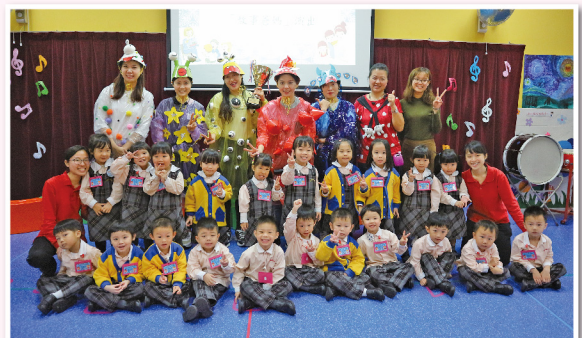
▲ 故事媽媽演出精采的話劇