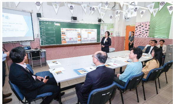
▲ 行政長官與陳局長了解過渡性社會房屋計劃的進度