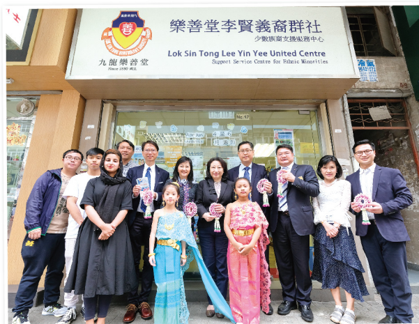
鄭司長(左三)等與少數族裔小朋友合照 ▶

律政司司長鄭若驊 GBS, SC 太平紳士與時任九龍城區議會主席潘國華先生以及九龍城民政事務專員郭偉勳太平紳士，於 2019 年 5 月 3 日到訪樂善堂李賢義裔群社 — 少數族裔支援服務中心，參觀中心的服務及設施，並與少數族裔居民傾談，了解他們的生活情況。