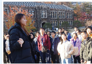
▲ 與延世大學學生交流