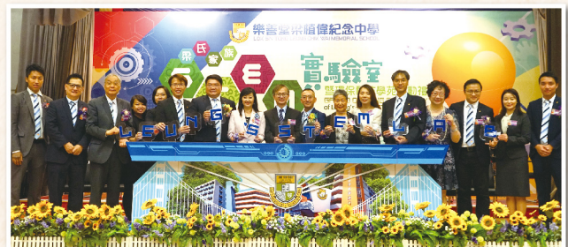
▲ 梁氏家族STEM實驗室暨環保科技學苑啟動禮