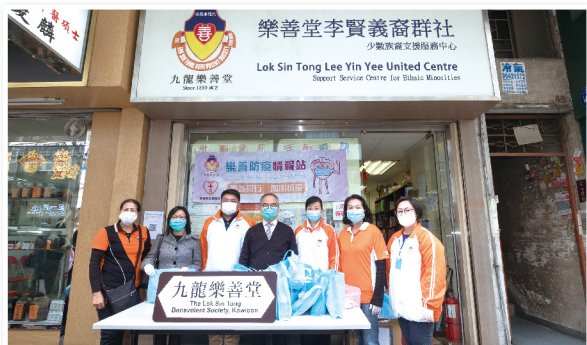
▲ 劉局長(右四)與總理及義工們合照