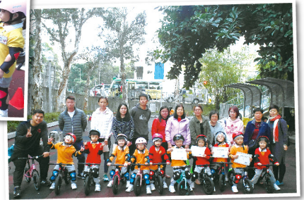
幼兒獲頒發證書以示鼓勵 ▶

透過平衡車訓練，幼兒學會操控平衡車，過程中需要運用肢體學習平衡、手眼協調及對空間環境的判斷。