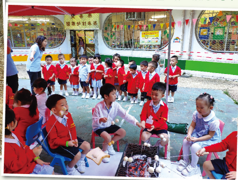
▲ 幼兒班學生在校園外花園進行探索活動