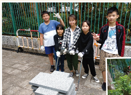
▲ 小孩的力量也不小啊！