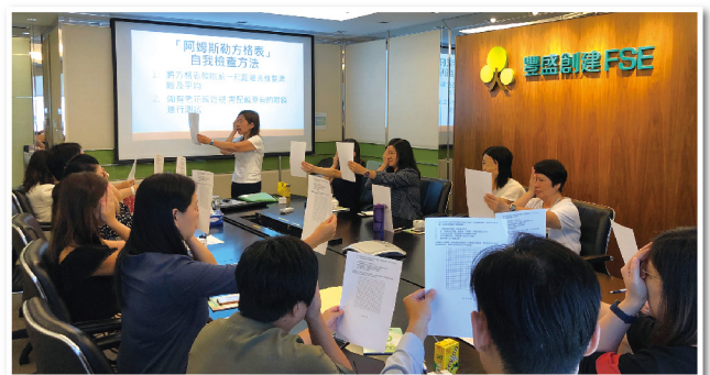
▲ 註冊護士與員工進行眼部護理疾病的自我檢測練習

「企業健康推廣平台」將繼續開展更多切合不同員工需要之健康推廣計劃，推動企業從不同層面參與及實踐員工健康政策，讓企業、僱員及社會各層面皆有所得益，達至三贏局面。