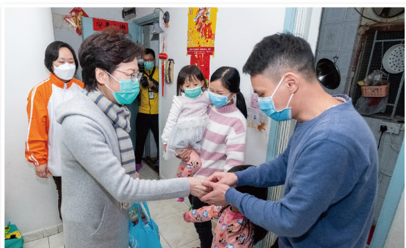
▲ 行政長官林鄭月娥女士探訪樂善堂社會房屋計劃的受惠家庭

行政長官林鄭月娥大紫荊勳賢 GBS 於 2020 年 2 月 17 日新型冠狀病毒疫情下探訪樂善堂社會房屋計劃的受惠家庭，向基層住戶派發口罩，了解他們所面對的生活困難。