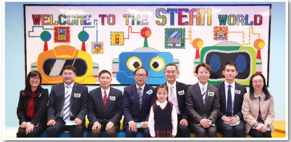
▲ 一眾主禮嘉賓在「李聖潑STEAM創意教室」內留影