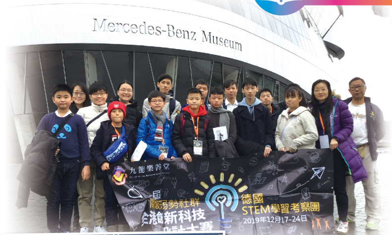
▲ 考察團於賓士博物館前大合照

本校發展不同的多元智能、課後延伸活動，各組別類型及範疇不斷擴展中，讓學生接觸不同的多樣化活動，尋找自己的發展方向及潛能。此外，學生積極參與各項活動及比賽，成績驕人：男子籃球隊於去年九龍東區小學校際籃球賽勇奪亞軍，三位主力球員入選「九東聯隊」，並於全港國際籃球賽中獲殿軍；本年九龍東區小學校際田徑比賽，於十八項田賽項目中獲六面金牌；學生通過參與不同的專項訓練及各種比賽，使他們擴闊視野及提升技能。