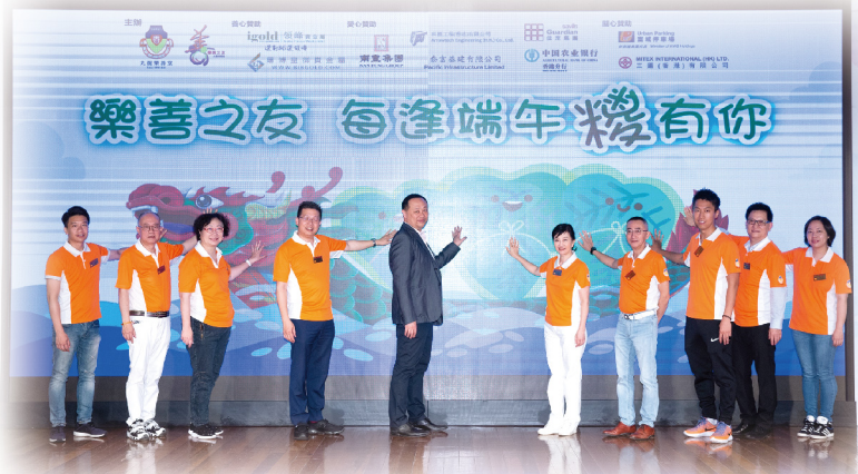
▲主禮嘉賓及一眾常務總理於探訪前進行啟動儀式，並為義工打打氣

「樂善之友」活動得到各界鼎力支持，每次參與的義工人數均屢創新高。我們期望能夠繼續凝聚各界友好的參與及支持，共同發揮「揚善積德，助樂扶貧」的精神，一起關懷社區。