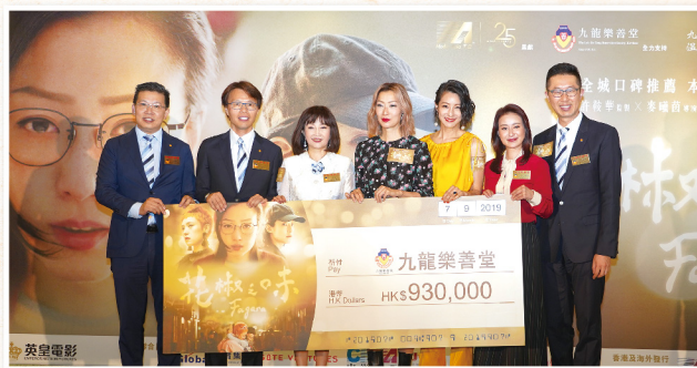
▲ 是次慈善首映為樂善堂青少年健康服務籌得近100萬經費，並由樂善堂主席團代表接受