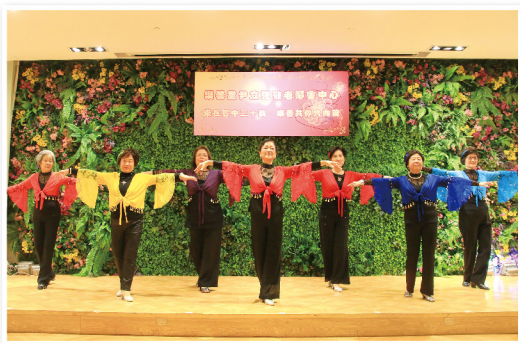
▲ 社交舞班學員表演