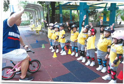
▲ 幼兒專心聆聽教練講解如何操控平衡車