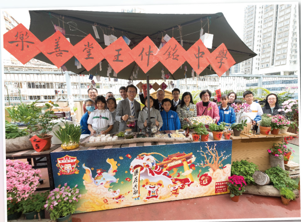
樂善堂王仲銘中學學生親手製作攤位及茶點予一眾總理同寅參觀及享用

樂善堂一向致力提供醫療、教育、安老及社會福利服務予社會大眾，並推行不同新服務，轄屬單位更遍佈港九新界。為使本堂總理同寅了解單位日常運作，於2020年1月20及21日到訪轄屬單位，並與長者們提早賀新春，並參觀不同單位新設施。