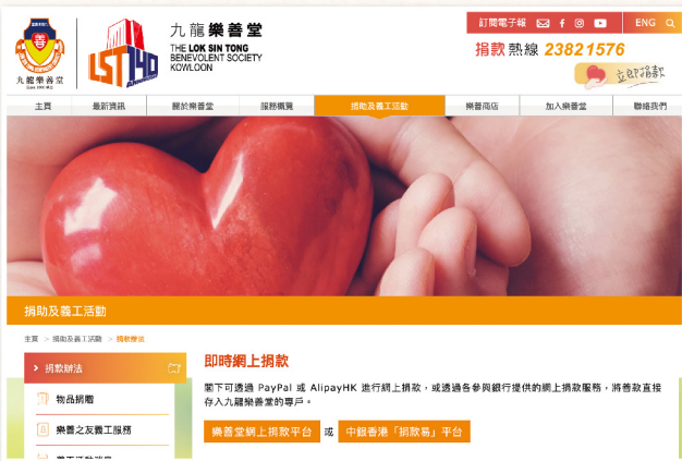
▲ 於網站增設中銀香港「捐款易」平台

平台提供多項捐款方式，如一般信用卡、銀聯、微信支付、轉數快、支付寶、EPS 等，而大眾只需瀏覽「捐款活動/服務」，便可以選擇支持項目：包括樂善堂醫療、教育、安老及社福服務、樂善關懷基金，或籌款活動，開展多元化的電子捐款途徑，擴闊捐款來源。