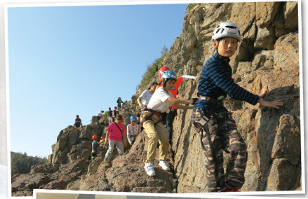
同學向攀石場地出發