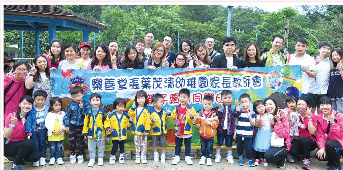
▲ 學生、家長及老師宿營渡過愉快的兩日一夜