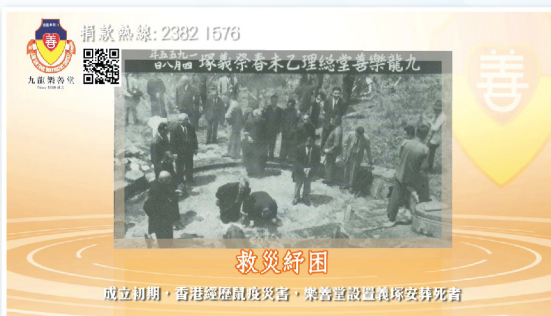
▲ 回顧樂善堂140周年的發展片段