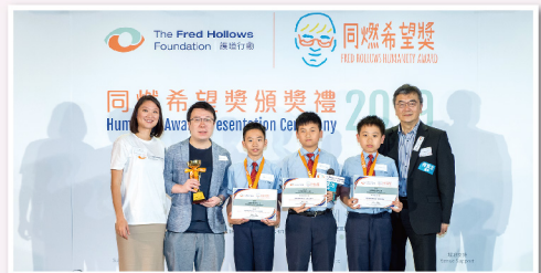
▲ 本校學生獲同燃希望獎

為了擴闊學生的眼界，本校也積極為學生安排學習以外的其他經歷，讓學生參與不同的境外交流活動，培養自理的能力、學習與人相處及尊重他人。