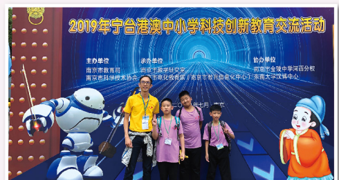
▲ 學生參加2019年寧台港澳中小學科技創新教育交流比賽