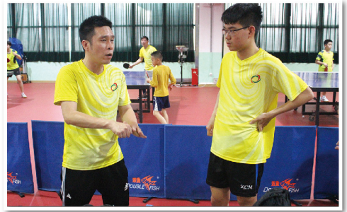
長者學苑乒乓球交流賽