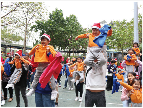
▲跟爸爸媽媽一起做運動

我們明白健康習慣從小做起，在課堂上安排學童進行「齊來洗手」及「我會刷牙」等活動，從而學會不同的生活技能，提升個人衛生意識，預防疾病及傳染病。