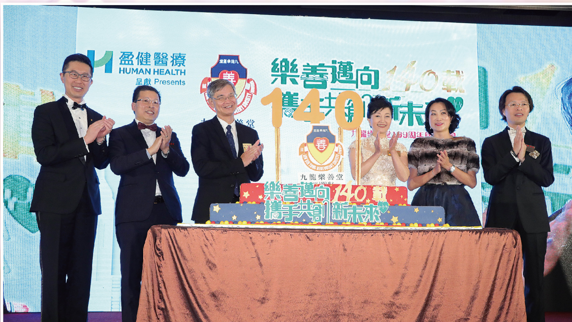
▲ 台上進行切蛋糕儀式，慶祝樂善堂邁向140周年