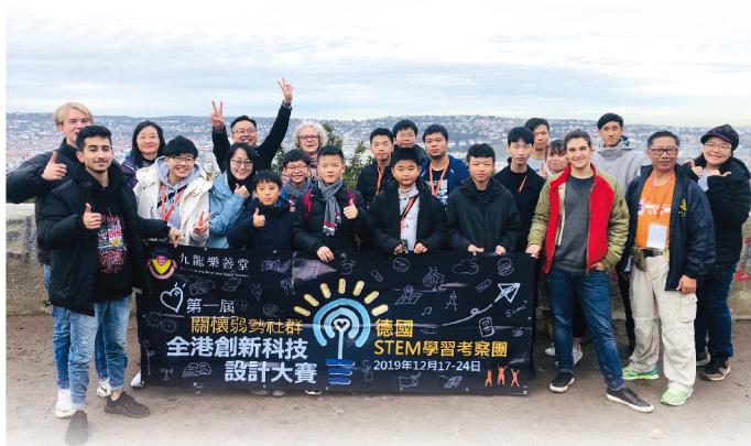
▲冠、亞軍隊伍於12月到訪德國交流學習