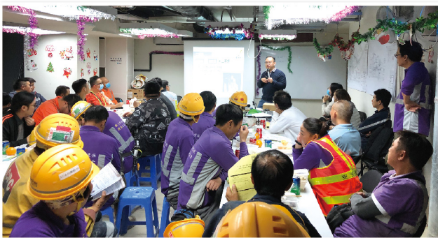
▲ 註冊社工以外展形式為前線員工講解煙害知識

物業管理「活出健康」計劃由衛生署《邁向 2025 香港非傳染病防控策略及行動計劃》「社區參與資助計劃」資助，計劃主要透過外展工作坊，向九龍城區物業管理公司員工講解四大非傳染病與生活習慣的各種關連，亦分享「零時間運動」概念，帶領員工一起進行練習，幫助他們將運動應用於日常生活中，減低患上非傳染病的機會。為加強服務成效，計劃亦透過與物業管理公司協作，於九龍城區屋苑放置及派發健康單張，增加公眾人士對非傳染病的認識，建立健康生活習慣。