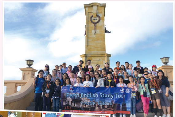
◀ 學生到澳洲進行交流考察

為了讓學生認識當地文化及拓展視野，本校老師帶領學生到英國、奧地利、德國、澳洲等地進行交流考察。