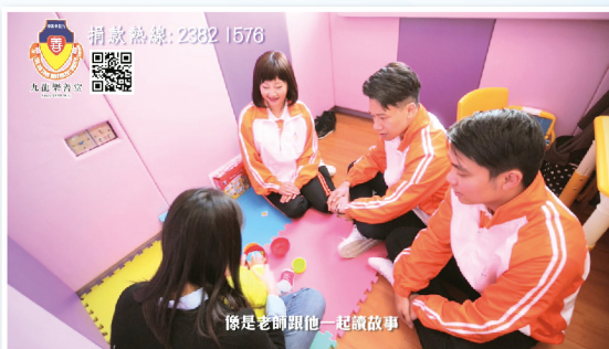
▲ 言語治療服務介紹