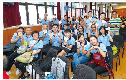
▲義工們為長者送上心意咭