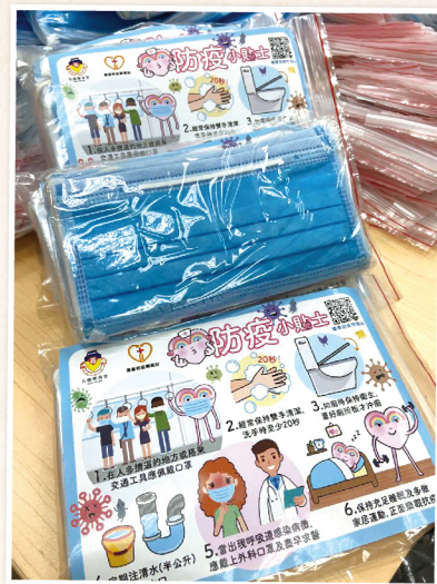
▲ 防疫口罩包上附有「防疫小貼士」

最後，本人特別感謝政界及商界多年來支持，並承諾樂善堂定必繼往開來，與時並進，為廣大市民提供更多適切的服務。