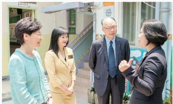
▲ 行政長官林鄭月娥女士(左一)與陳帆局長(右二)到訪九龍城樂善堂小學校舍

行政長官林鄭月娥大紫荊勳賢 GBS 與運輸及房屋局局長陳帆太平紳士於 2019 年 8 月 9 日到訪九龍城樂善堂小學校舍，以了解改建校舍作過渡性社會房屋計劃的進度。