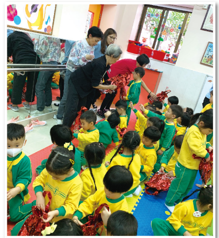
▲ 義工探訪幼稚園學生，一同慶祝聖誕節

中心獲社會福利署老有所為活動計劃贊助，舉辦一項名為左鄰有「您」心·節日添暖意活動。活動透過招募長者成為「關懷大使」，關顧周邊獨居長者，特別於傳統節日中親手炮製傳統美食與人分享，於節日送上祝福和關懷，以發揮老有所學及老有所為的精神。活動包括「中秋顯關懷」：由長者義工親手製作低糖奶黃月餅送予區內獨居長者；「長幼同歡賀聖誕」：義工到訪區內幼稚園，與幼稚園學生共慶聖誕推動跨代共融；「冬至添暖意」：由義工自家制健康盆菜，與護老者及長者齊玩遊戲兼過冬，讓長者感受節日氣氛。