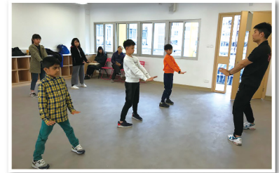
▲ 認真學習國術詠春