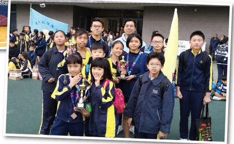
▶ 田徑隊再創佳績 ▶