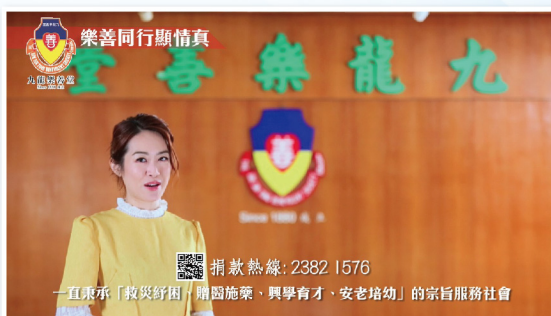
▲ 本堂推出新一輯「樂善同行顯情真」電視宣傳片