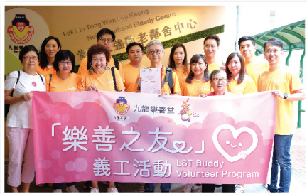
▲義工們出發前合影留念