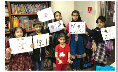
▲ 民族手繪班(Henna)學生展示他們的作品