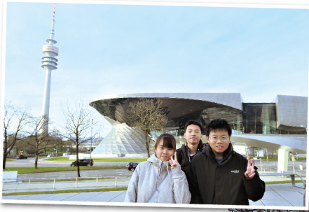
◀ 同學參觀寶馬博物館認識汽車設計、物料和引擎上的演變，更學習了寶馬汽車創辦人永不放棄的精神

整個德國之旅讓學生有機會走出課室，親身體驗德國的文化和先進科技。他們不但對這個工業、工程和科技位居世界前列的強國加深了認識，STEM方面知識更有所增長。同學們不約而同地表示此行讓他們大開眼界，十分難忘，感受到「讀萬卷書，不如行萬里路」的真諦。