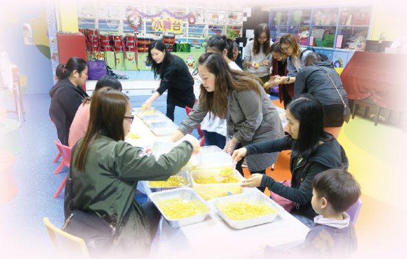
家長義工到校協作製作聖誕聯歡會的食物

在幼兒的成長過程中，家庭與學校起了相輔相成的作用，透過緊密的聯繫，各自擔任着引導者、關懷者、鼓勵者等不同的角色，對幼兒的成長及發展，家校是不可或缺的。故本園著重家校合作，互相信任、尊重、了解，保持良好的夥伴關係，定期舉辦不同的親子活動，例如：親子旅行、講座、家長觀課、親子月餅製作班、親子卡拉OK比賽、親子宿營，加強學校對家長的了解及聯繫，共同攜手幫助學生健康成長。家長亦透過參與學校義務工作，清晰了解學校的理念，配合學校的發展，達致家校合作的效果，亦從不同渠道收集持分者意見，以促進校園的優化，期望能建立良好的夥伴關係及溝通橋樑，互相凝聚力量，齊心去為幼兒提供一個健康、關愛、和諧的校園。✿