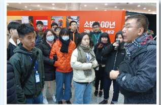
▲ 參觀市民安全體驗館

「讀萬卷書不如行萬里路」，為豐富學生的學習經歷，讓他們體驗異地文化，本校於2019年11月27至30日舉辦「韓國科技及文化交流團」，安排全級中五學生到韓國首爾進行科技及文化遊學考察。