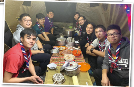
▲ 1819 童軍露營－老師校友合照