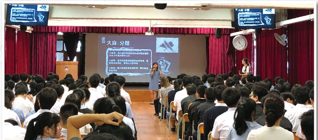
▲ 透過禁毒講座，以輕鬆方式傳遞抗毒信息和知識，推廣反吸毒文化，提倡無毒健康生活