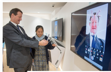
同學介紹人工 智能應用程式