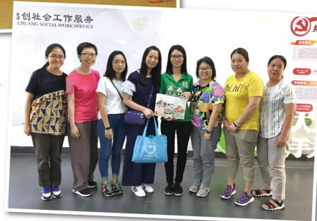
▶ 完成探訪後，團員代表機構致送紀念品給「廣州市啟創社會工作服務中心」