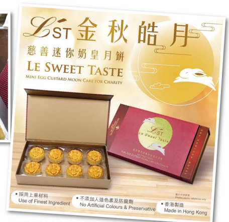
▲ 慈善迷你奶皇月餅

膳食服務中心致力為九龍城、黃大仙、慈雲山等地區人士，提供營養膳食及送餐服務，而所有營養膳食餐單由註冊營養師度身訂造，並向非牟利團體、青少年中心、企業及志願機構等提供團體營養飯餐服務。中心亦會提供節日派對到會美食服務及季節性食品（如端午粽、月餅和盆菜等），本年度更首次售賣賀年糕品套裝，反應熱烈。