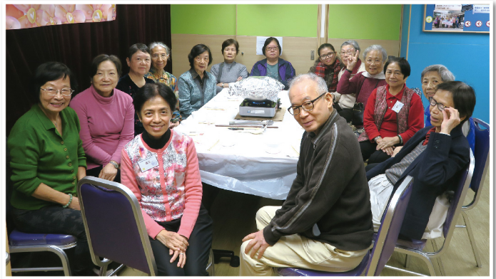
▲ 由義工製作盆菜與長者共慶冬至