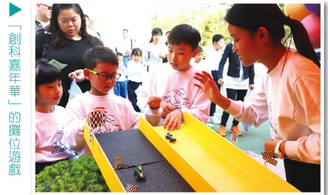
▶ 「創科嘉年華」的攤位遊戲

2019年2月22日(星期五)，「李聖潑 STEAM 創意教室」舉行了盛大的開幕典禮。當天，本校非常榮幸邀得中聯辦教育科技部劉建豐副部長、香港教育城總監鄭弼亮先生、香港立法會梁志祥議員 SBS,MH,JP 擔任主禮嘉賓，令典禮生色不少。同日，我們亦舉辦了「創科嘉年華」，招待區內幼稚園生、家長及老師到校，活動內容包括開幕典禮、STEAM 工作坊、攤位遊戲、創科樂園等。整個活動有超過五百多位來賓出席，場面十分熱鬧，亦令區內外嘉賓及家長對學校推行 STEAM 教育有更深入的瞭解。