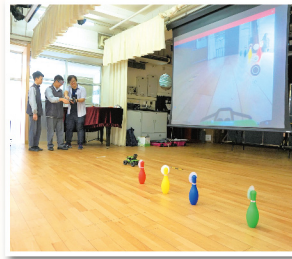
▲ 透過模擬醉酒駕駛，令同學明白飲酒會減低方向感及判斷力

衛生署於 2019-20 年度再度委託九龍樂善堂於全港超過 60 間中學舉辦新一期「年少無酒」中學生互動講座。互動講座由本堂的註冊護士及註冊社工擔任講者，旨在讓學生了解酒精相關禍害、破解飲酒迷思、對酒商用來吸引年青人飲酒的廣告和宣傳手法提高警覺、學習拒絕酒精引誘的方法等。互動講座當中設有各式各樣的互動遊戲環節、角色扮演及播放專家解說影片等，學生均積極投入參與。本堂相信互動講座不但增加學生對酒精禍害的知識，也加深了學生「向酒精說不」的正確態度。計劃預計服務超過 10,000 名中學生。