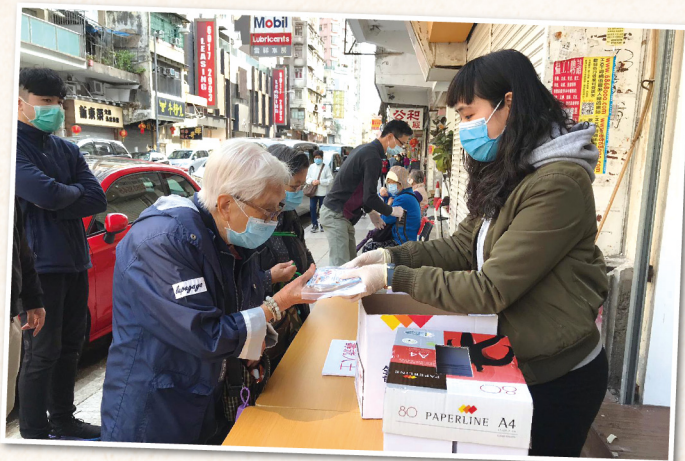
▲ 派發善長捐贈之口罩予有需要人士