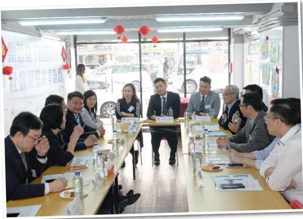
蘇副局長與立法會小組委員會視察樂善堂小學環境 ▶

運輸及房屋局副局長蘇偉文 BBS 太平紳士與立法會小組委員會於 2019 年 4 月 30 日參觀樂善堂的社會房屋計劃「樂屋」，並視察樂善堂小學環境，以了解改建校舍作過渡性社會房屋的項目。隨後，議員參觀「樂屋」的共享服務間，並探訪多個受惠家庭，了解他們的居住情況。