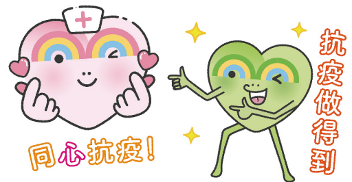
▲ 卡通人物及插畫設計