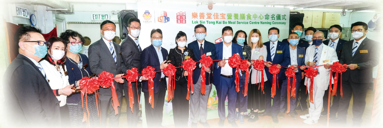
▲眾嘉賓一起為「樂善堂佳寶營養膳食中心」進行開幕剪綵儀式