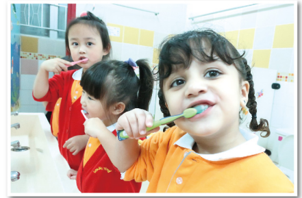
▲安排幼兒進行「我會刷牙」活動，培養幼兒自理習慣

營造關愛校園，建立良好品格與健康的生活方式，一直是本園的發展重點。我們致力為學童培養健康的生活習慣和技能，以達至勇於面對困難和挑戰，對抗逆境，建立正面的人生觀與價值觀。我們制訂「健康校園」政策，將健康元素融入課程之中，又舉辦多元化的活動，積極推動個人衛生、健康飲食、適量運動等文化，務求以多角度、不同層面協助學童成長。