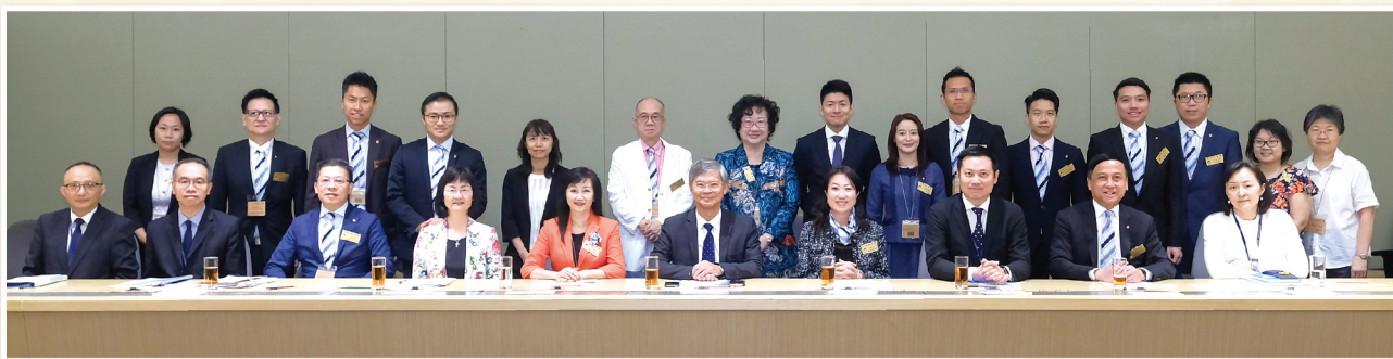
▲ 本堂總理與勞工及福利局局長羅致光博士 GBS 太平紳士(前排左六)及其他官員進行會面交流