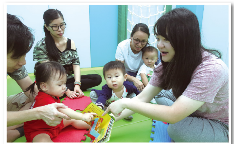
▲ 透過親子工作坊，家長學習訓練幼童的技巧，增強家長育兒的信心

社工透過「家庭功能評估」認識家庭的壓力位，予以指導、情緒支援、提供管教技巧及家居訓練建議，增強家長處理壓力之餘，更能發掘父母個人、家庭及社區的可用資源，增強抗逆的能力。我們相信強化家庭功能，有助兒童健康成長。此外，計劃支持中心會設立家長互助社，定期舉辦專題家長工作坊及設家長資源閣，提供家居訓練教材、光碟、繪本及各類學習支援工具以供家長參考。