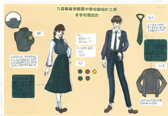
轄屬學校校服設計比賽得獎作品設計圖