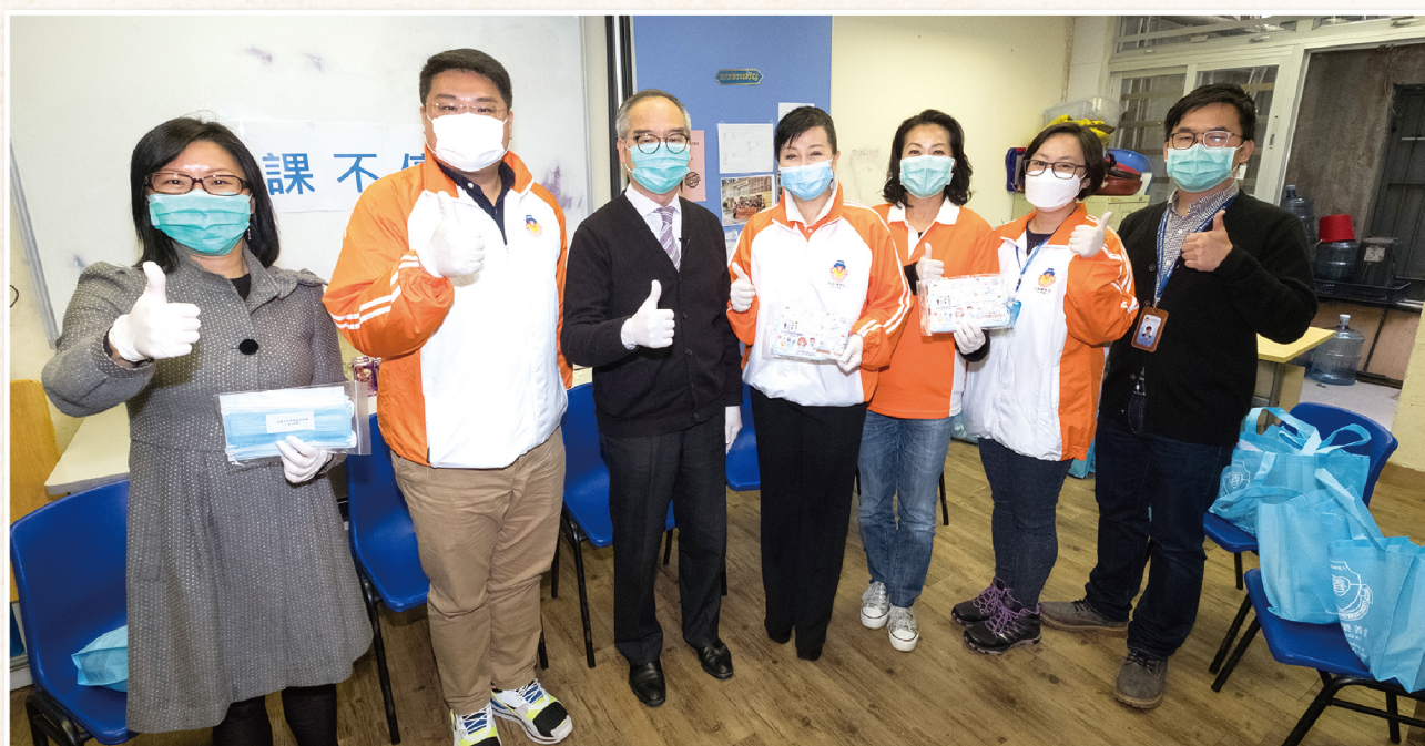
▲ 時任民政事務局局长劉江華太平紳士(左三)一同參與派發口罩