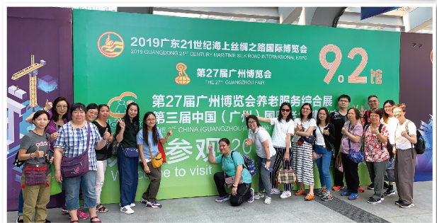
▲ 參觀「第 27 屆廣州博覽會養老服務綜合展暨第三屆廣州國際老年健康產業博覽會」的大合照