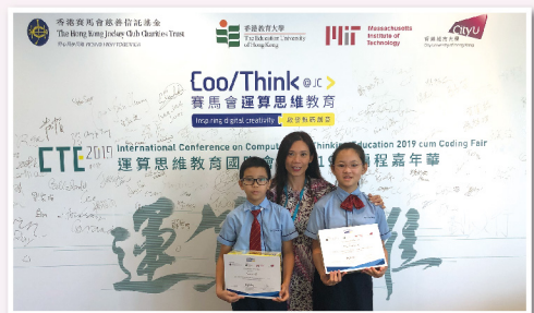
▲ 本校兩名學生獲CoolThink嘉許獎