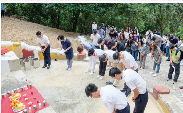
▲為追念先德，樂善堂按照每年傳統均舉行春秋二祭

本堂同寅於每年清明及重陽節期間均由當屆主席率領，敬備金豬、香花、楮帛等祭品前往本堂位於西貢井欄樹之義塚，舉行春秋二祭，追念先德。