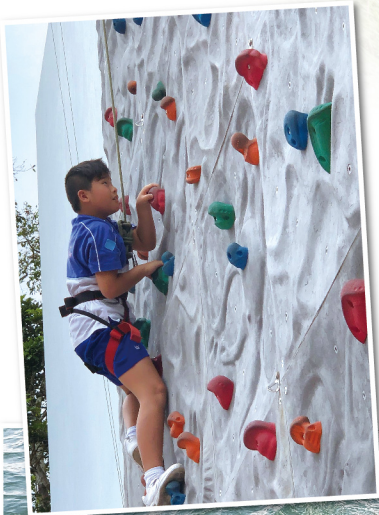
◀ 學生要克服畏高的心理關口，攀上高達七米的人工石牆

本年度學校得到乘風航及香港青年協會的邀請，為高小的學生安排了多次歷奇活動，讓學生體驗在課堂以外的特別經歷。大部分學生在活動開始時都顯得無奈及抗拒，甚至有人哭泣及發脾氣，但聽到部分同學挑戰成功分享及導師的鼓勵下，這班驚慌的同學終於願意離開自己的「舒適圈」，克服畏水畏高的恐懼，完成了任務。事後同學們回顧這些經驗，除了覺得難忘之後，亦更認同只要抱持樂觀的心和鼓起勇氣，面對逆境仍然可以積極面對。