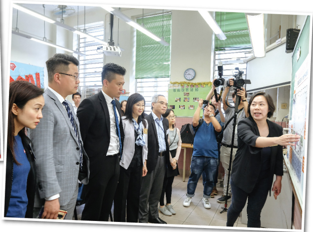
◀ 蘇副局長及立法會小組委員會到訪「樂屋」的共享服務間