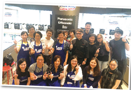
完成團隊烹飪合作後的開心大合照

另外，參觀「第 27 屆廣州博覽會養老服務綜合展暨第三屆廣州國際老年健康產業博覽會」（老博會）成為今次行程最重要的一環，能夠透過老博會，觀摩國內近年新科技及醫療輔助工具的發展，相信能為安老院舍或居家服務帶來新的幫助及轉變，亦令團員獲益良多。