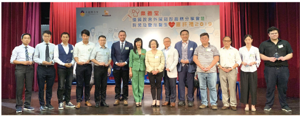
▲ 舉辦大型服務分享會，同時嘉許參與院舍及愛心醫生