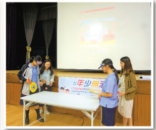
▲ 學生戴上醉酒眼鏡，體驗醉酒後對視覺及平衡感的負面影響