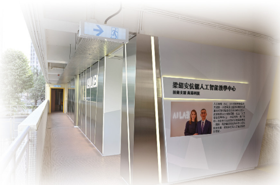
人工智能教學中心

「余中」更獲商湯科技的支援，借鏡世界人工智能的課程，並與香港城市大學應用程式實驗室張澤松博士協作，共同規劃及設計一套適合香港學生學習人工智能的課程和教材。而新課程亦將成為本校中三級學生的必修課，以承接中一級的圖像編程、中二級的物聯網教學知識，進一步鞏固、完善學生在科技方面的學習，從而激發更多新意念和發展空間，將知識在生活上學以致用。完成課程的優秀尖子，有望到城市大學進修；亦有機會參與商湯科技的先導計劃，為日後從事人工智能事業而鋪路。✍