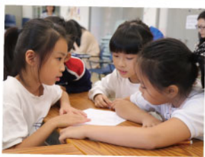
▲ 通過合作學習，一起解決問題