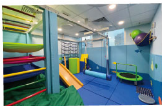
▲ 兒童專用的感覺統合活動室