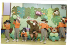
▲ 配合音樂和故事遊學習英語