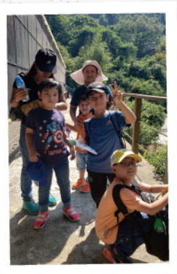
▲ 嘉道理農場內的定向追蹤活動