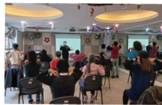
▲ 賽馬會「50 展新晴」婦女健康計劃運動班