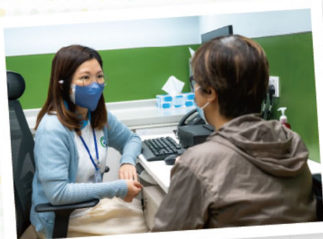
▲ 護理統籌主任為會員進行健康風險評估及個人健康管理

九龍樂善堂一直致力支持政府提倡及推動基層醫療服務發展政策，承蒙醫務衛生局委托本堂於 2021 年起成為九龍城及油尖旺地區康健站營運機構。地區康健站由跨專業團隊組成，包括：護理統籌主任、註冊社工、物理治療師、營養師、藥劑師及社區健康工作員，務求提升社區人士自我管理健康意識及得到全面及個人化的跟進服務，攜手建立健康社區。