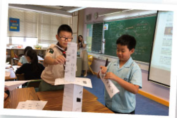
▲ 德育課-增加學生解決問題的能力