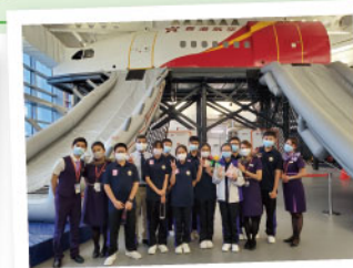
▲ 參觀香港航空，與機師及空中服務員見面及交流，訂定未來發展方向