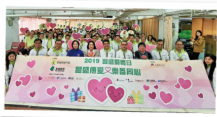
▲ 2019 豐盛關懷日