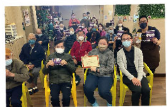
▲ 和悅會長者日間護理中心舉行長新冠講座

合資格人士為於油尖旺、九龍城及黃大仙區內居住或工作的新冠病患康復者（綜合社會保障援助受助人、獲書簿津貼的家庭、公共屋邨住戶可獲優先考慮），並符合以下條件：曾確診2019冠狀病毒病並受長新冠影響（須在確診後9個月內）；及長新冠病徵會在確診3個月內出現，並持續達1個月或以上。