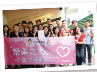
▲ 「樂善之友」義工活動