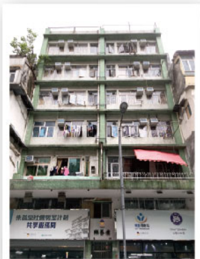
▲ 首期「樂屋」計劃翻新閒置住宅單位作過渡性社會房屋，租予3-4人基層家庭