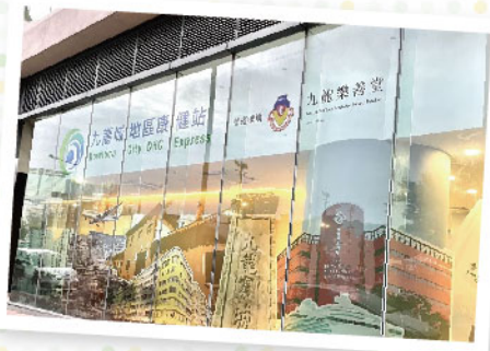
九龍城地區康健站為大眾提供 ▲ 基層醫療服務