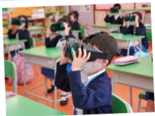
▲ 學生利用VR進行產擬實境學習