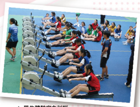
▲ 學生體驗室內划艇