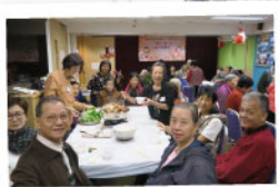
◀ 由義工製作食物，會員享用的冬至聚會