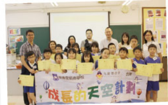
▲ 小四-迎新啟動暨家長教師分享會