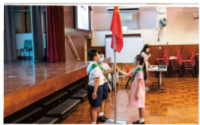
▲ 開學禮升國旗儀式