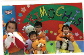
▲ KIMMOCHIS情智教育協助兒童認識及管理情緒