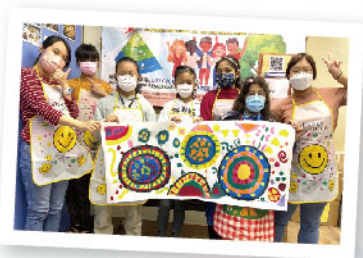
▲ 泰裔及南亞裔兒童參與及巨型圓形畫活動