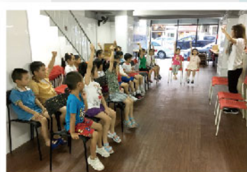
▲ 為加強對受助家庭的社區支援，計劃善用地舖位置建立「共享服務間」，提供舉辦家庭和兒童活動