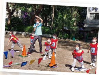
▲ 齊來體驗做運動員的歡樂和自豪