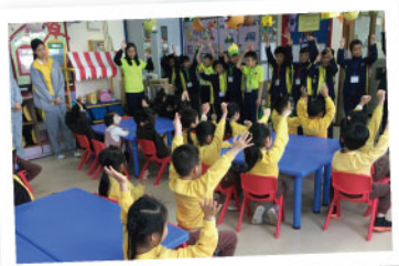
▲ 小四愛心之旅，學生到學校附近的幼稚園當小義工