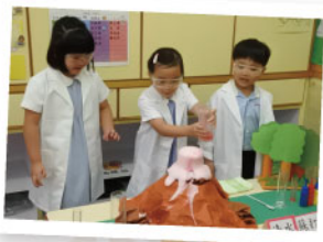
▲ 學生化身小小科學家，動手做科學實驗