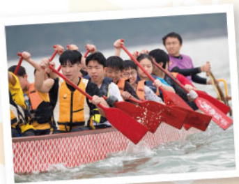
▲ 學生們參與龍舟訓練