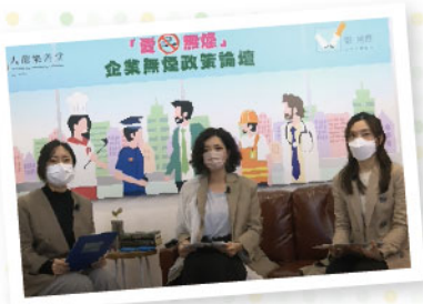
▲ 「無煙政策論壇」網上活動，講解「吸煙與三高」專題，並向企業分享無煙政策建議

如有興趣申請外展健康教育計劃或加入企業健康推廣平台，可致電 2272 9870 與職員查詢。