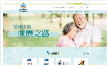
樂善復康站-網購平台 ▲