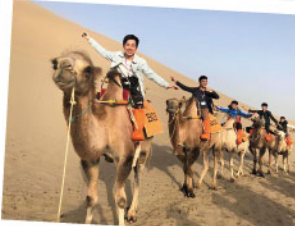
▲ 甘肅考察認識不同文化與地貌，增廣見聞