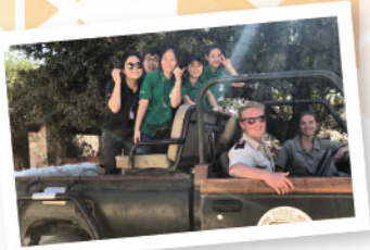
▲ 在南非野生動物保育區與世界各地義工交流

九 九龍樂善堂於1880年成立，以「救災紓困、贈醫施藥、興學育才、安老培幼」為宗旨。尤其在「興學育才」範疇上，本堂前人打破古時「女子無才便是德」的守舊觀念，認為男女應平等接受教育。在1929年，先後開辦女子及男子義學，為兒童及青少年提供免費教育和學習的機會；其後更自資籌建及接辦多間政府資助中、小學，造福莘莘學子，打下百年樹人的基礎。