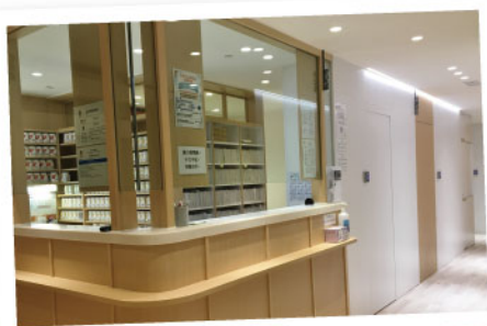
▲ 樂善堂陳廣興紀念基層醫療中心候診區

本堂成立至今已143年，一直秉承「救災紓困、贈醫施藥、興學育才、安老培幼」四大宗旨，為市民服務。本堂將繼續回應社會各界的不同需要，大力發展更多創新項目，貫徹「關懷情真、樂善同行」之精神。