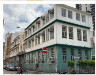
▲ 全港首個「改建校舍」作過渡性社會房屋項目，提供51個單位，2020年8月獲發入伙紙