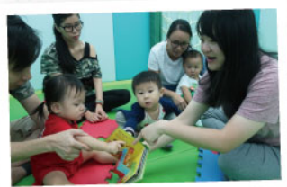
▲ 透過親子工作坊，家長學習訓練幼童的技巧，增強家長育兒的信心