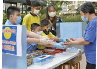
▲ 為長者送上中秋愛心月餅