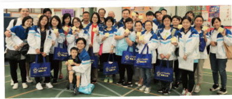
▲ 「樂善之友」企業義工參與探訪活動

樂 善堂於2009年成立「樂善之友」義工團，旨在推動社會大眾參與義務工作活動。「樂善之友」透過服務配對及舉行不同之義工活動，包括社區探訪等，鼓勵來自不同界別的義工為社會弱勢社群送上關懷；並冀望義工回饋社會同時，於個人成長中有所得著，各展所長。「樂善之友」由成立至今，累積參加義工人數已超過 18,000 人次。