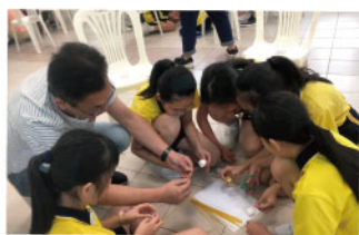
▲ 透過合作遊戲促進親子的溝通，深入了解子女的特質