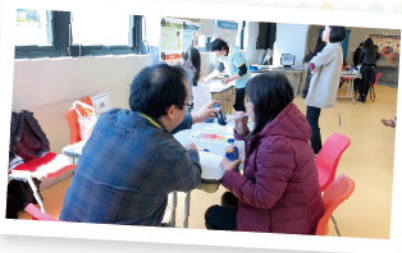
▲ 為企業員工進行一氧化碳呼氣測試

其中「愛·無煙」前線企業員工戒煙計劃是以協助企業推動無煙文化為目標，以外展形式提供多元化的戒煙服務，包括為員工提供無煙健康講座、一氧化碳呼氣測試、基本健康檢查及為期一年的電話戒煙輔導等。計劃亦會協助企業訂立內部無煙政策，從營運模式、硬件配套、企業形象及內部培訓等多方面為企業設計及籌辦具可持續性的員工健康方案。