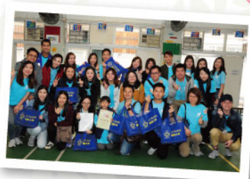
▲ 義工們出發前大合照

樂 善堂於2009年成立「樂善之友」義工團，旨在推動社會大眾參與義務工作活動。「樂善之友」透過服務配對及舉行不同之義工活動，包括社區探訪等，鼓勵來自不同界別的義工為社會弱勢社群送上關懷；並冀望義工回饋社會同時，於個人成長中有所得著，各展所長。「樂善之友」由成立至今，累積參加義工人數已超過 18,000 人次。