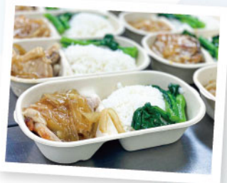
▲ 可生物降解之環保餐盒