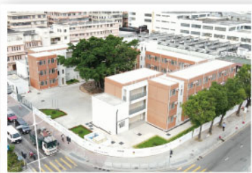
▲ 位於宋皇臺道及土瓜灣道交界的項目，以「組裝合成建築法」興建，約提供110個單位