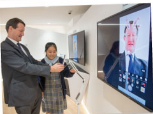
▲ 同學介紹人工智能程式應用