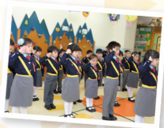
▲ 交通安全隊精神奕奕又整齊