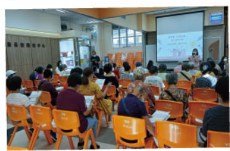
▲ 賽馬會「50展新晴」婦女健康計劃健康講座