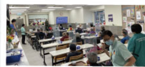
▲ 標準錶針長者日間護理中心舉行長新冠講座