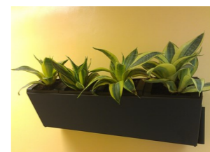
虎尾蘭及特別設計「為下一代著想」的無煙標誌