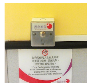
創新的無煙廣播系統