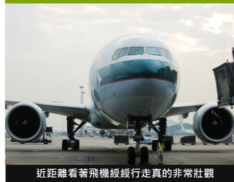
近距離看著飛機緩緩行走真的非常壯觀

機底是一個很繁忙而且當很重要的地方，大部份負責物資及行李運送、維修、以及飛機升降的前線員工都會集中於此處工作。不少於機底工作的員工需隨時候命以應付每日不同的突發事件。當日講座途中，亦見很多員工進進出出，可見他們工作真的非常忙碌！