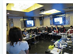
有否想過卡拉OK房，可以舉行健康講座？

Neway善用員工培訓活動的機會，推行員工健康政策及鼓勵員工建立健康生活。除與本機構合作舉辦無煙講座以外，企業亦會推行不同類型的課程及康樂活動，例如職安健康安全講座、壓力管理工作坊、負面情緒管理講座、結他班、魔術班、龍舟隊、歌唱比賽等等，務求讓同事在不同領域上盡展才華，培養健康的嗜好及增強抗逆能力。