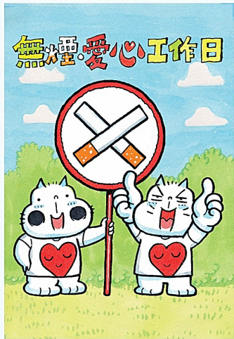
今年樂善堂與「草日」合作，共同推廣「無煙・愛心工作日」