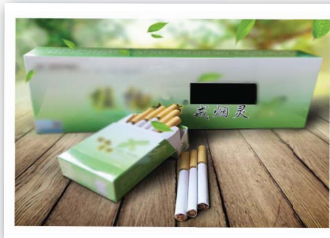
網購平台「戒煙靈」包裝展示圖

筆者曾經接觸過一個十分有趣的戒煙個案，案主為一中年女士。她向筆者表示，除了向戒煙服務尋求協助之外，她還表示「自己也有做功課」。細問之下，原來所謂的「功課」，是指在內地網站購買了一款俗稱「戒煙靈」的戒煙產品使用。