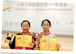
▲ 在小學太陽能模型車 mini 奧運會比賽中獲季軍