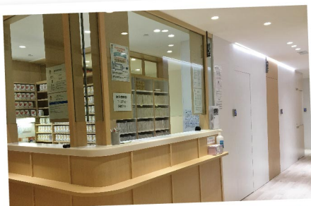
▲ 樂善堂陳廣興紀念基層醫療中心候診區

本堂成立至今已140年，一直秉承「救災紓困、贈醫施藥、興學育才、安老培幼」四大宗旨，為市民服務。本堂將繼續回應社會各界的不同需要，大力發展更多創新項目，貫徹「關懷情真、樂善同行」之精神。