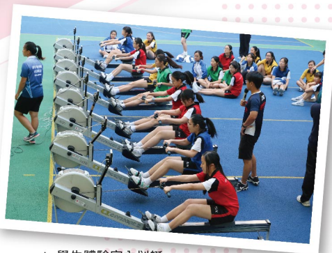
▲ 學生體驗室內划艇