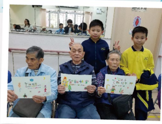
▲ 「愛心服務隊」為長者送上祝福