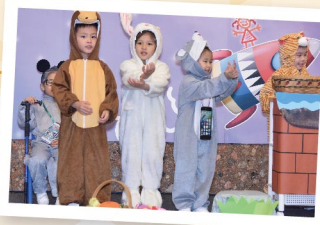
▲ 「童心創造真·善·美」計劃獲「第十四屆藝術教育獎（學校組）」，同學們在分享會向大眾展示計劃成果