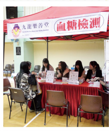
▲ 社區健康檢查 - 血糖檢測

本堂一直致力推展「外展健康教育計劃」，服務旨在提高公眾對身心健康的關注，鼓勵市民身體力行實踐健康生活模式，達至健康人生。本堂每年與眾多團體攜手合作舉辦超過30場活動，合作機構包括地區長者中心、學校、私人企業、工會、非牟利團體等，服務深受大眾歡迎。計劃負責團隊包括醫生、中醫師、護士、社工，以外展形式於社區舉辦健康講座、諮詢服務、健康教育展覽、健康檢查、疫苗接種等活動。服務主題一般會配合團體的需要而制定，務求讓服務使用者獲得適切的健康資訊及專業健康意見。本堂亦會主動將服務推展到不同的社會階層，加強基層醫療所的疾病預防效果。