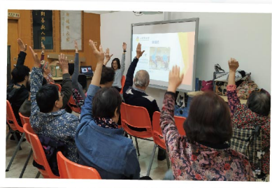
▲ 踴躍地做健腦操，訓練頭腦