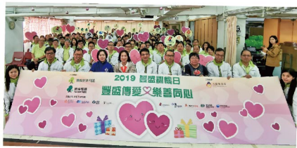
▲ 2019 豐盛關懷日