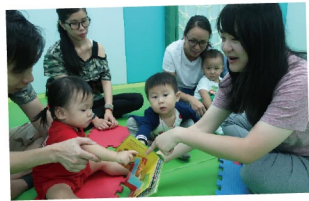
▲ 透過親子工作坊，家長學習訓練幼童的技巧，增強家長育兒的信心