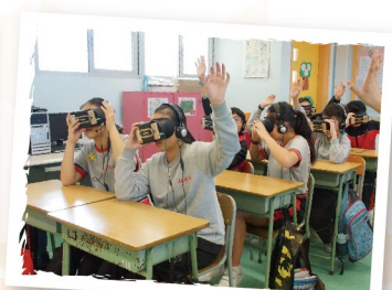
▲ 學生利用VR到訪垃圾堆填區