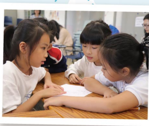
▲ 通過合作學習，一起解決問題