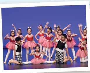
▲ 爵士舞校隊隊員參加「學校舞蹈節」比賽