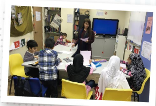
▲ 巴基斯坦學童認真學習中文