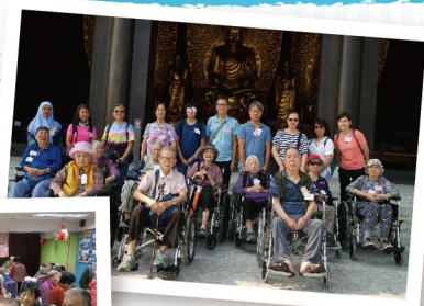
◀ 由義工製作食物，會員享用的冬至聚會