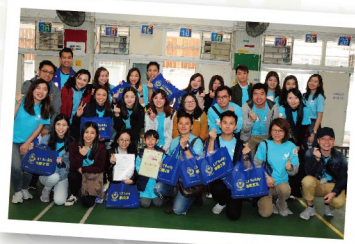
▲ 義工們出發前大合照

樂 善堂於2009年成立「樂善之友」義工團，旨在推動社會大眾參與義務工作活動。「樂善之友」透過服務配對及舉行不同之義工活動，包括社區探訪等，鼓勵來自不同界別的義工為社會弱勢社群送上關懷；並冀望義工回饋社會同時，於個人成長中有所得著，各展所長。「樂善之友」由成立至今，累積參加義工人數已超過6000人次。