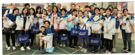
▲ 「樂善之友」企業義工參與探訪活動