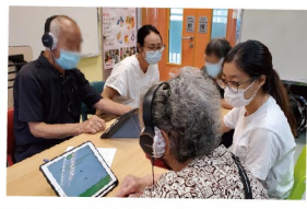
▲ 使用電子程式為年長人士進行認知能力測試