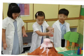
▲ 學生化身小小科學家，動手做科學實驗