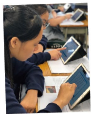
▲ 各科用電子學習軟件加強學習效能