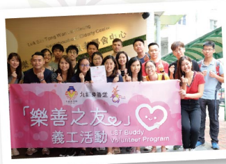
▲ 「樂善之友」義工活動