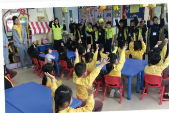
▲ 小四愛心之旅，學生到學校附近的幼稚園當小義工