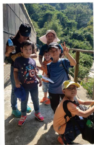
▲ 嘉道理農場內的定向追蹤活動