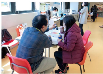
▲ 為企業員工進行一氧化碳呼氣測試