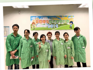
▲ 在經歷體驗活動後，同學們更有信心地確定自己護理業的職志