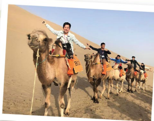
▲ 甘肅考察認識不同文化與地貌，增廣見聞