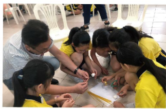
▲ 透過合作遊戲促進親子的溝通，深入了解子女的特質

計劃主要協助基層學生，制訂長遠的個人發展規劃，建立有形（金錢）及無形（社交、人際關係）的資產，促進弱勢社群兒童的長遠發展，改善跨代貧窮問題。計劃內容包括友師訓練、家長工作坊、學生及幼師活動、學校活動、戶外體驗活動參觀及個人發展計劃等。