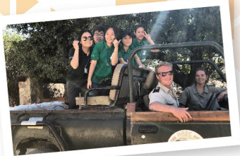
▲ 在南非野生動物保育區與世界各地義工交流

九 龍樂善堂於1880年成立，以「救災紓困、贈醫施藥、興學育才、安老培幼」為宗旨。尤其在「興學育才」範疇上，本堂前人打破古時「女子無才便是德」的守舊觀念，認為男女應平等接受教育。在1929年，先後開辦女子及男子義學，為兒童及青少年提供免費教育和學習的機會；其後更自資籌建及接辦多間政府資助中、小學，造福莘莘學子，打下百年樹人的基礎。