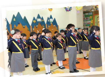
▲ 交通安全隊精神奕奕又整齊