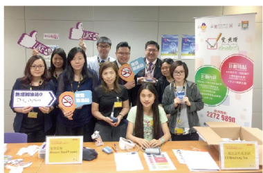
▲ 計劃團隊協助企業推行世界無煙日活動

「企業健康推廣平台」是樂善堂推出的嶄新健康推廣概念，主要以企業為推廣媒介，透過安排跨專業團隊以外展形式到企業作推廣，鼓勵僱主建立「健康工作間」及推展員工健康政策，從而提高員工對健康的關注。服務內容包括戒煙、減酒、壓力管理、養生保健等健康主題。在政府及各界支持下，計劃由開展至今已累計服務超過350間企業及10,000位企業員工。