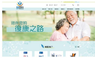
▲ 樂善復康站-網購平台