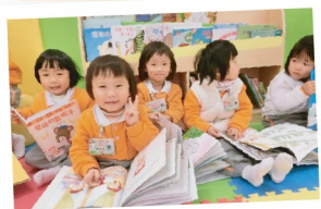
▲ 幼稚園學生全情投入享受繪本閱讀的樂趣