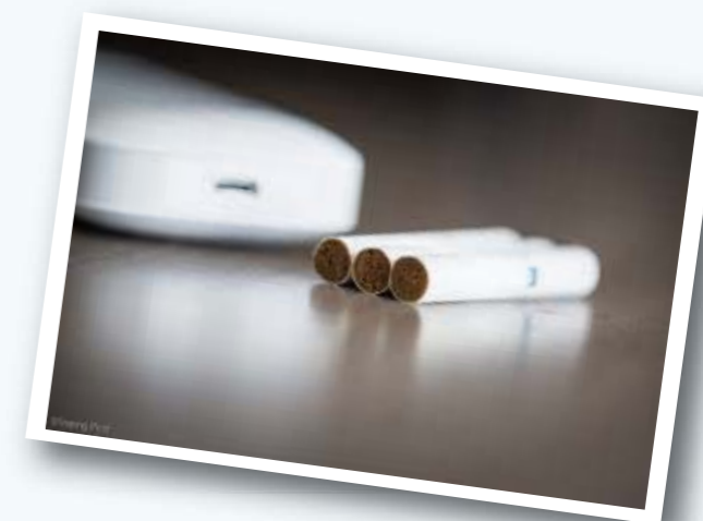
加熱不燃燒煙草產品 (註：網絡圖片)

現在Heat Not Burn 還未在香港合法銷售，只能經沒有規管的水貨店購買，其品質來源沒有保證，非常危險，隨時會因為電池短路而引致火警。煙棒含其他不知名的有害物質，令人吸食後有機會導致不知名的後遺症，奉勸各位千萬不要試。另外由於Heat Not Burn還未在香港合法銷售，在香港買賣該產品都是犯法，不要以身試法。